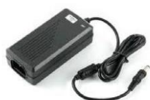
EL0031203/EL0031202 EL0035630/EL0031201 EL0031200